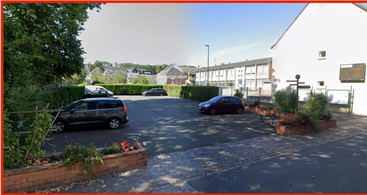
Parking face à l'Hôtel de Ville